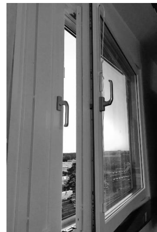
Bild 4. Öppna fönstret - dreh

De nya 3-glas fönstren (bild 1) har kipp-dreh tvåfunktionsbeslag (bild 2), där fönster är hängda både i underkant och på sidan. När handtaget är i horisontellt läge/vågrätt (bild 3) vädrar man (kipp). Bågen lutar inåt i överkant. När handtaget är i vertikalt läge/lodrätt uppåt (bild 4) öppnar man fönstret i