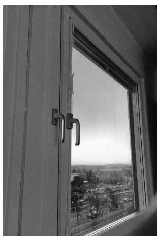
Bild 1. Nytt fönster med vädringslucka

Parabler får sedan inte sättas upp i fönsterkarmen eller -ramen eller i själva fasaden. Skruva inte fast termometrar eller annat i de nya fönstren. Bryter du mot bestämmelsen kan du bli skyldig att stå för kostnader för återställning.