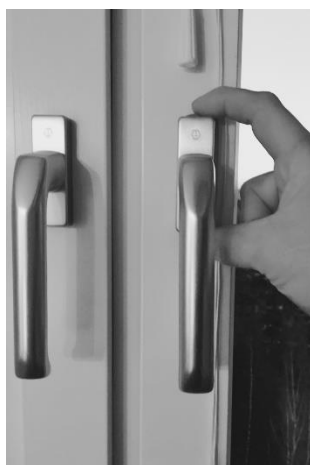
Bild 2. Kläm ihop och vrid