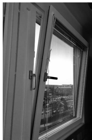
Bild 3. Vädringsläge - kipp